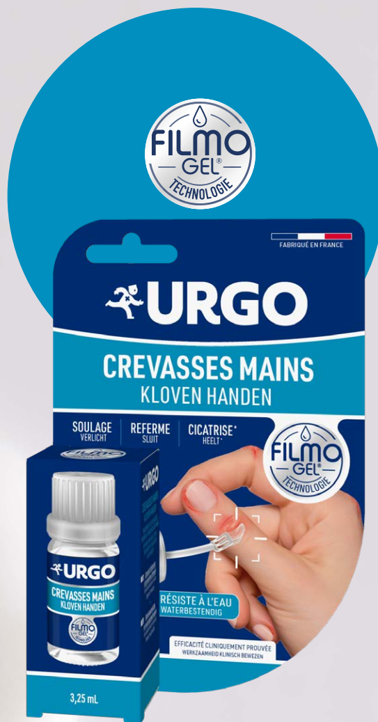
URGO Filmogel® Crevasses Mains Flacon de 3,25 mL, 15,50€*