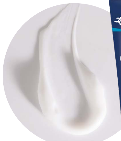
Filmogel® Fissures Lèvres URGO, Tube 7mL, 9,90€*