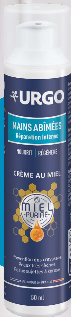
URGO Mains Abîmées Réparation Intense Crème au miel Flacon de 50 ml, 11,50€*

Les solutions URGO pour prendre soin de sa peau et prévenir la sécheresse des mains.