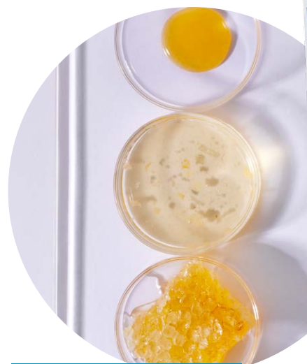
Baume Ultra-Riche Lèvres abimées URGO, Tube 10ml, 7,90€*